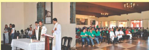
4º Aniversário Terço dos Homens