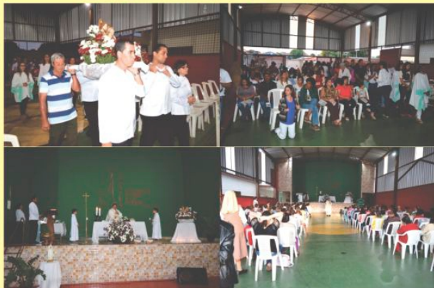
Festa em louvor à Sagrada Família